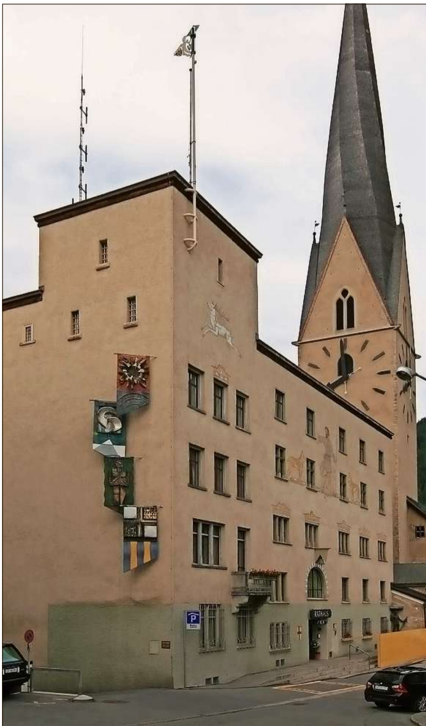
Chasa-cumin a Tavau. Las pli veglias parts da l'edifizi dateschan da ca. 1560; l'aspect odiern deriva da las reconstrucziuns dals onns 1880 e 1930.